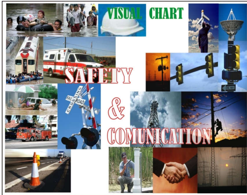
Gambar 4.23 Visual Chart